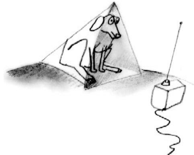
Antik Sándor: Rajz, 2002

Csak néztem rá beszédes szemével, s egy kicsi figyelmeztetést véltem kiolvasni pillantásából. Nem tudtam mire vélni. Gyorsan le-