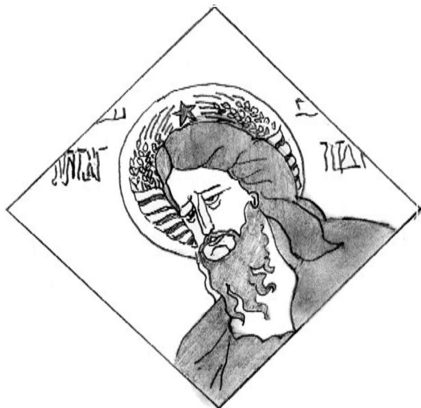
Desen după o imagine apărută în săptămînalul american Time, 10 aprilie 1989

Pentru a reface măcar ceva din atmosfera acelor vremuri și pentru a evidenția modul de acțiune, mîină în mîină, al statului și BOR, vom recurge la cîteva mărturii de epocă, din cele adunate chiar de stăpînirea comunistă prin uneltele ei.